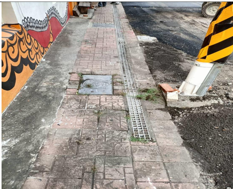
茂林里中央馬路兩側(高 132 線道)排水溝設施改善案。