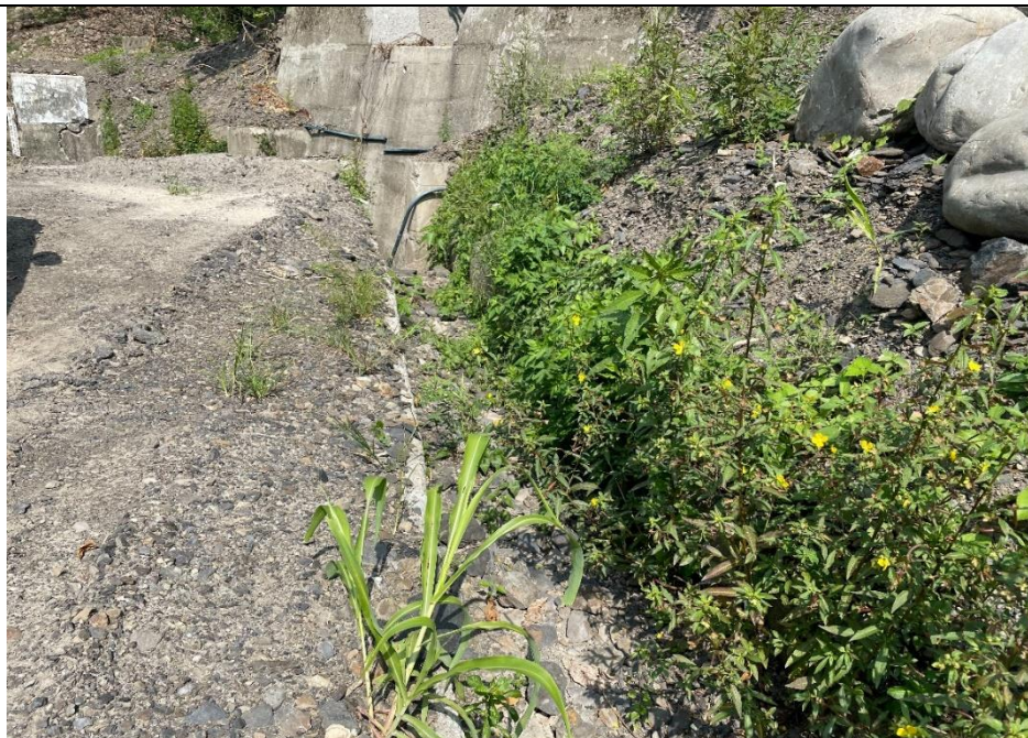
設格柵板排水溝蓋並於大排水溝處設置護欄案