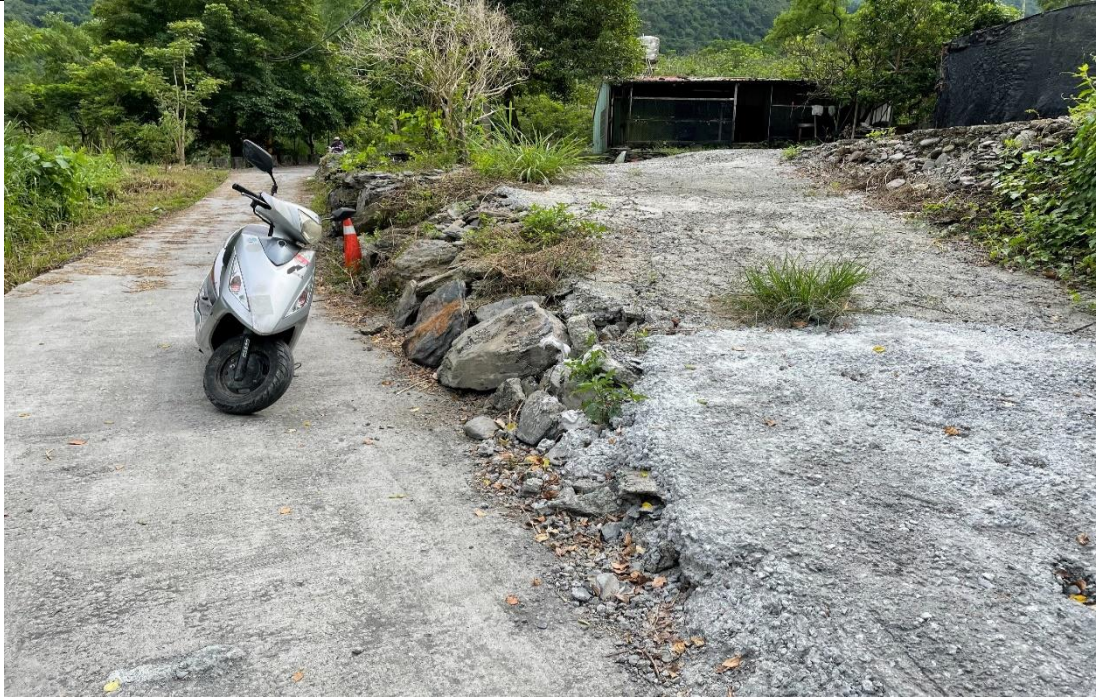
情人谷瀑布外環道拓寬並綠美化案