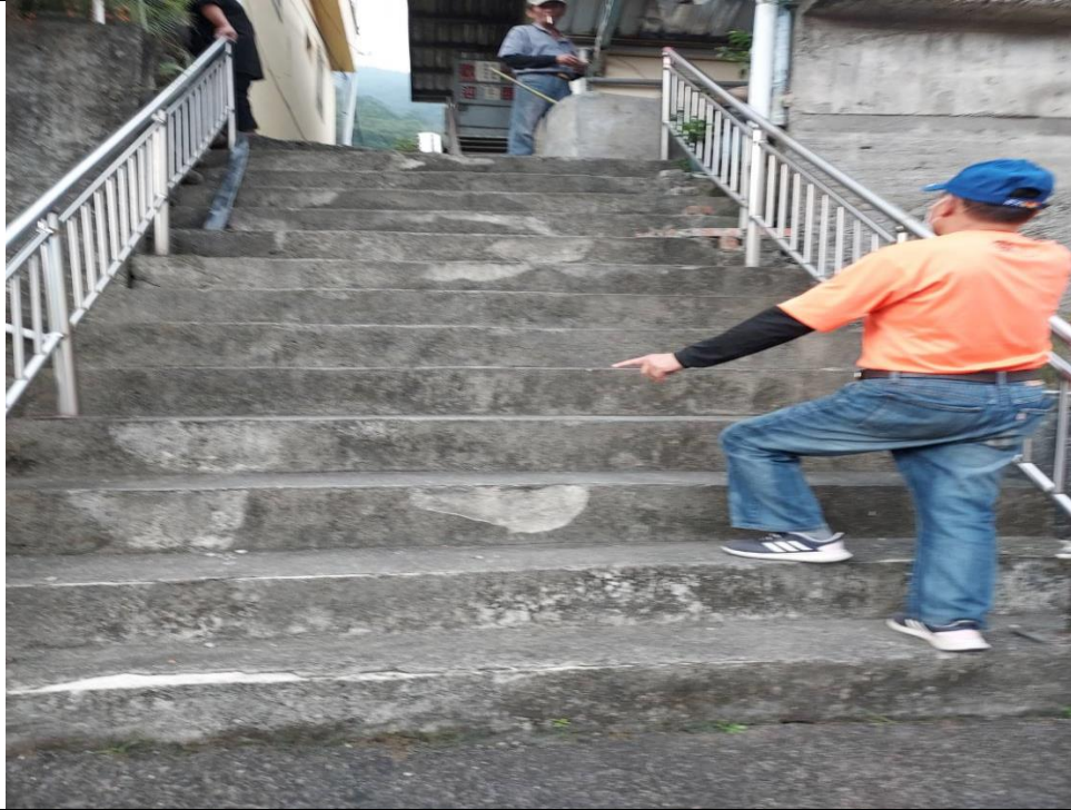
萬山里部落階梯通道太過陡峭改善案