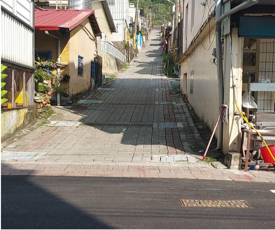
茂林區三個里彩繪及環境美化成部落特色案。